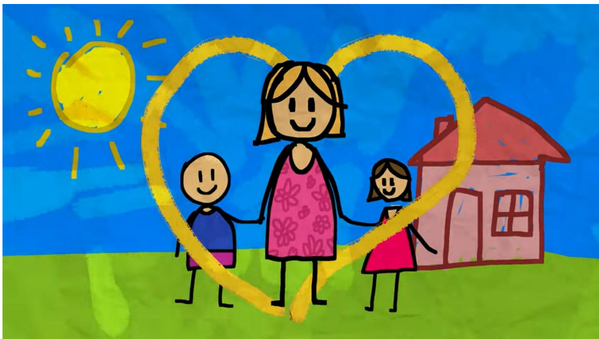
Zespół Dziecięcy Fasolki - Życzenia dla mamy Piosenki dla dzieci - YouTube